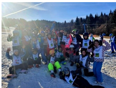
Šolar na smuči – športni dan v 4. razredu (smučišče Bela, januar 2020).

Model B: v času izvajanja pouka po Modelu B in trajanja priporočil NIJZ se dnevi dejavnosti izvajajo na šoli oziroma na epidemiološko varnih lokacijah ob upoštevanje priporočil NIJZ.