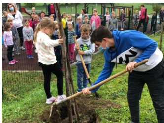
ENO sajenje drevesa, 23. 9. 2020.